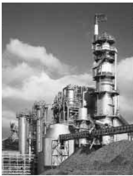
塩素を使用しない漂白方法を採用した日本最大級のパルプ製造設備

市青年の家 演劇の楽しさ見に来て 3/20 から万代演劇祭を開催 万代市民会館内にある市青年の家では、青年の家を「万代演劇祭」を開催します。