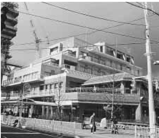
市民の福祉活動の拠点となる総合福祉会館

ヘルプが入り、1階のボランティアセンターと合わせ市民の皆さんの福祉活動の拠点となります。4・5階には貸し出し用の会議室を配置しています。同館には、玄関やエレベーター前に、音声による誘導システムを設置するほか、赤外線補聴システムのある車いすバスケットボールなどができる多目的ホールや、茶道や華道を行うことのできる技能習得室などもあります。3階には市社会福祉協議会と市福祉公社・まごころ