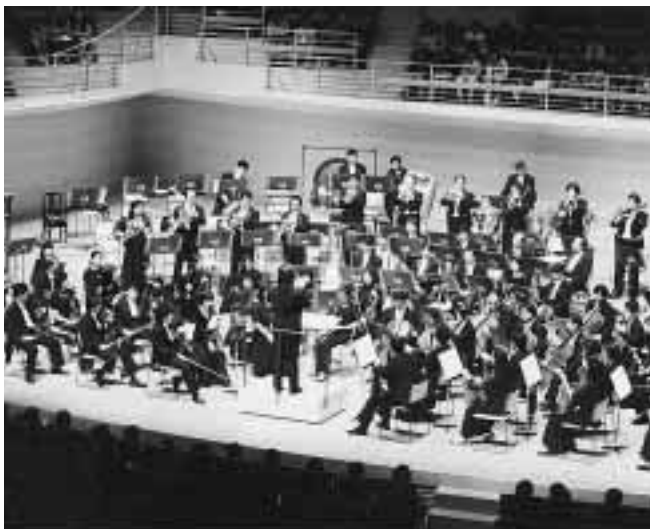
東京交響楽団～昨年10月28日に実施した全小学5年生を招待したコンサートより

問い合わせ 青少年課 (内線3262、3264)へ 説明会 1月28日午後1時半、1月29日午前10時半、11時半、どちらかへ参加 学習会 2月9日午前10時半、午後0時半 スタートの会 2月24日午前10時半、午後0時半 会場・申し込み 市女性センター「アルザ」(246-7713)へ