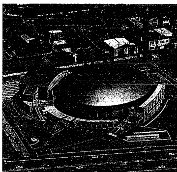
建設の進む東総合スポーツセンター

竹尾インターチェンジ近くの、はなみずき三丁目、平成八年から建設を進めている東総合スポーツセンターが、十月二十一日にオープンします。天井高が最高二二・五メートル(約七六層の高さ)あり、観客席数三千二百席を備えたメインアリーナをはじめ、同センターはプロスポーツや全日本クラスの大会も開催可能です。また、オープニング事業として、個人利用の無料開放などを行いますので、ぜひご利用ください。