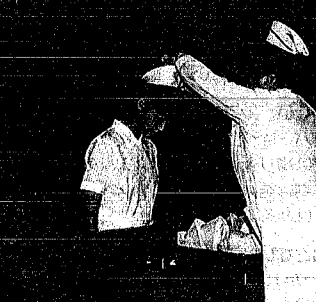
看護婦(士)としての第一歩となる戴帽式(上)とキャンドルサービス(右)

自治・町内会長として、地域で大きな役割を果たしている皆さんに感謝しよう。自治会長・町内会長に感謝の集いが、十一月四日に開催されました。 集いには約六百五十人の自治・町内会長が出席。会長は数十年前以上の六十九人を表彰しました。