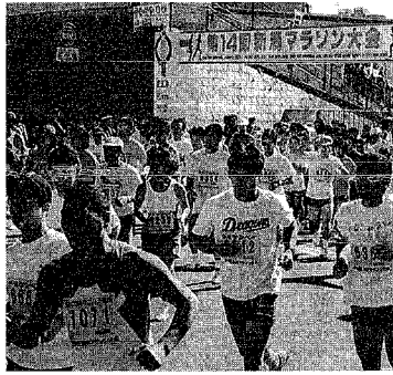
陸上競技場をさっそうと飛び出すランナーたち ～昨年の大会から

10月10日「体育の日」に表の4施設を無料開放します。 なお、バドミントン、卓球、バスケットボールの利用に際しては、用具をご持参ください。体育室の個人開放は、各開始時刻15分前に窓口で整理券を発行します。(注意)小学4年生以上は成人の付き添いが必要。屋内プール利用の際は泳帽が必要。トレーニングルームでは、トレーニングウェア、内履用運動靴が必要 ※西総合スポーツセンター裏の国道402号のバイパスは、新潟マラソン開催のため、午前10時10分から午後1時40分まで全面通行止めとなります。車でのレストランは、産業道路側、満ち女子高校隣の臨時出入口をご利用ください。