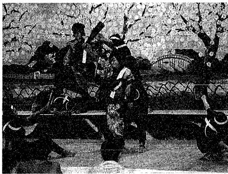
市劇場芸術講座 (N-PAC Workshop) による歌舞伎制作

市芸術文化振興財団では、来秋オープンする市民文化会館(仮称)のプレ事業として実施している「舞台芸術創造ワークショップ」に出演する役者を、市民の皆さんから募集します。 公演は来年三月二十七日、夜二回で、会場は市民プラザ。歌舞伎座で活躍する役者と、共に舞台上立ち、「腰元役」を演じてもらいます。