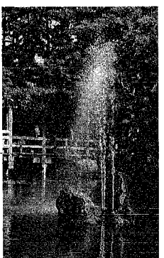
白山公園 明治6年に開設され、古くから市民の憩いの場として親しまれてきました。池、築山、花木を配したオランダ風の回廊式庭園です。

新潟駅南口広場 待ち合わせ場所として、若者でにぎわう憩いの空間。夜にはライトアップされ、幻想的に映し出されます。