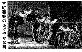
古町芸妓のあでやかな舞