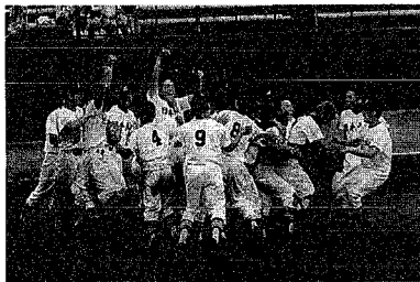
優勝が決まりマウンドに集まるナイ (中越高校を四対二で破る)