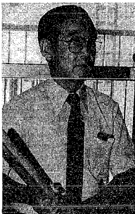
昭和8年、東京は浅草生まれ。昭和19年に学童疎開のため母親の実家である新潟に移住。