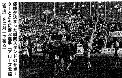
アルビレックス 北信越リーグ制する(7/27) (サッカー)

発行日 毎週日曜日 発行 新潟市 〒951 学校町通1-602-1 編集 総務部広報課 印刷 ㈱第一印刷所