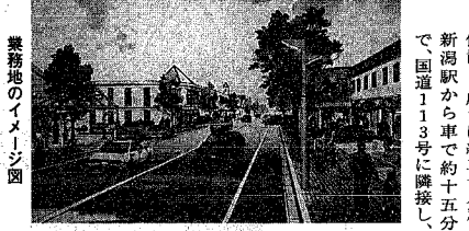
業務地のイメージ図

同地区は、新潟空港の西側、国道113号の北側に位置し、広さは約二十八万平方メートル、国道113号に隣接し、新潟駅から車で約二十分、国道113号に隣接し、