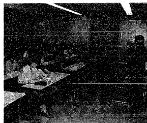
集団給食施設などを対象とした食中毒予防研修会に、冷蔵庫や棚など

気温の上昇とともに、ハエやゴキブリなどの衛生害虫が活発に活動し、食中毒が多発する季節となりました。O157を保菌したハエからO157が検出されました。ハエやゴキブリは、汚物の上や水溝などの不潔な場所ので生活するため、食中毒の発生を防ぎ、食べ物の管理には十分注意して、食中毒を防止しましょう。