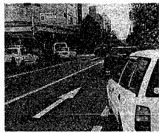
違法駐車が後を絶たない西堀通り

同条例は、違法駐車 が後を絶たず、交通に 重大な支障を及ぼす地域を 違法駐車防止重点地域に指 定。平日と日曜日の週二日、 交通誘導員が重点地域内を 巡回し、周辺の駐車施設を 案内するチラシなどを配布 します。