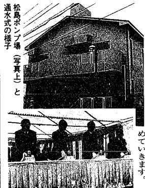
松島ポンプ場(写真上)と通水式の様子

平成六年度から山の地下区に建設を進めてきた、松島ポンプ場が完成し、六月十一日に通水式が行われました。同ポンプ場は、近年頻発する集中豪雨による浸水被害から山の下地区を守ろうと、市が積極的に推進している雨水排除改善事業の一つとして建設。既設の雨水ポンプ場の処理能力をはるかに上回る、一時間当たり約四十六立方メートルの降雨に対して、総事業費は約十四億円です。鉄筋コンクリート造りで、地上二階、地下一階建て。口径八百センチ、ポンプが三台設置され、毎秒約三・七立方メートルを排水。同施設で山の下の地区南部の二十五軒の雨水を排水することにより、既設の山の下のポンプ場の負担を軽減し、同地区の浸水被害を軽減します。