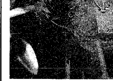
水酸化工事の様子