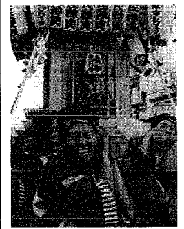
新潟まつりを盛り上げる市民みこし

日時 5月13日〜7月29日毎週日曜午前10時〜正午。会場 坂井輪地区公民館。内容 子どもの世界を広げよう、親子遊びほか。参加費 360円。対象 2・3歳児とその親先着30組(親のみ可) ※保育あり先着30人。申し込み 会場(☎269-2043)へ。中学生セミナー〜中学生の気持ちに近づかために〜。日時 5月8日〜6月12日毎週木曜日午前10時〜正午。会場 鳥屋野地区公民館。対象 中学生の保護者先着30人。参加費 1,000円※保育あり(要予約)。申し込み 会場(☎285-2371)へ。