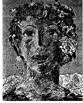
絹谷幸二「銀嶺の女」1997年製作