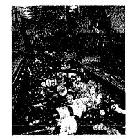
手作業で行っている、びん選別

全市民で6分別収集スタート。びん缶はルールを守って。昨年四月にオープンした「エコプラザ」では、毎日、西新潟地区で回収される「びん・缶」が選別、資源化されています。現在までの処理量は月平均約三百。これらを利用している、びん選別