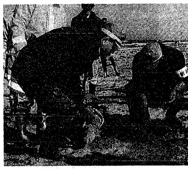
内野上新町浜で重油の回収作業を行う長谷川市長(左)

ナホトカ号からの重油流出事故に対し、市では一月二十一日に「新潟市N号流出油災害対策本部」を設置。以来、多くの市民の支援や協力により、順調に回収作業が続いています。この災害に対し、ボランティアの申し出や救援物資など、たくさんの方々が心を合わせて支援してくれています。