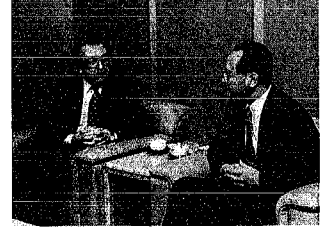
パノフ・ロシア大使

本市に、東アジアの酸性雨についての国際的な拠点施設が設置されることである。今後、酸性雨問題の解決とともに、世界への情報発信基地として大きく貢献していくものと期待している。