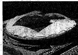
W杯が開催される新潟県総合スタジアム(仮称)の完成予想模型

会場となる新潟県総合スタジアム(仮称)は約四万二千人を収容でき、県が鳥屋沼南部の鳥屋野総合運動公園に建設します。今後は、日本に設置されるL