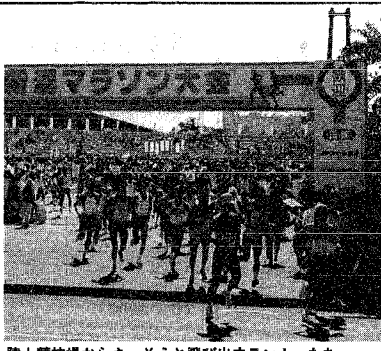
陸上競技場からさっそうと飛び出すランナーたち ~昨年の大会から

16ミリ映写機操作講習会 日時 10月16日、11月20日、12月18日午前9時~午後4時半 会場 市視聴覚センター 参加費 450円 申し込み 会場(☎222-7400)へ