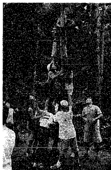
リーダーを中心に全員が力を合わせないと達成できないインテグレーションゲームの一コマ

子どもたちに、大自然の中で物事をやり遂げることの難しさと素晴らしさを協力することの大切さ、自覚することのおうと「青少年