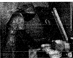
小・中学校などに設置した給食のサンプル保存用冷凍庫

学校給食用の食材を納入している業者には連絡会を開き、食材の当日納入の徹底や、手洗いの励み、殺菌などの衛生管理の徹底を要請しています。各学校で消毒などの予防策の徹底を図って