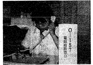
市民からの問い合わせに答える職員

市民の皆さんの不安や質問に答えようとして、専用電話相談窓口O157を開設。下痢などの健康状態に関するのや、食品関係、環境関係や予防対策についてなどさまざまな相談が寄せられています。