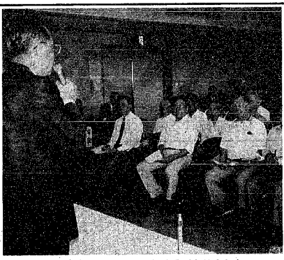
質問や意見などに活発な発言がありました

海一周辺の道路および交通問題について。市長 マリンピア日本海にも七割の人が訪れ、それも七割の人が県外のお客である。新潟の魅力の一つとして機能果たしていると思ふ。五月の連休やお盆の期間中は連日一万人を超える入館者があり、それと同時に大渋滞する。渋滞を解消するため、①小張木園屋敷については、都市計画決定されている寄居浜線(海岸道路)までの早期着工(海浜道路)の寄居浜事業化を検討する②寄居浜女性池線の道路幅員について