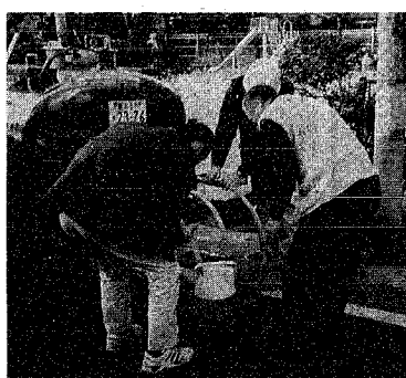
阪神・淡路大震災の被災地で給水活動を行う市水道局

市では、過去に大地震などの自然災害に遭った全国五百自治体と、このたび「災害時相互応援協定」を結びました。この協定の締結により、不時の災害に見舞われても、復旧経験を持ち、災害支援のノウハウを蓄えている都市からの、的確な援助が期待できるようにになりました。 協定を結んだのは、関東大震災や雲仙普賢岳の噴火など、過去に大規模被害を受けたことのある仙台市、福井市、島原市、墨田区、そして、東海沖地震に備えて防災体制の確立を急いでいる静岡市の四市一区です。