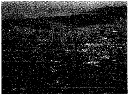
現在の分水町と大河津分水路

「横田切れ」は、明治二十九年七月、豪雨のため分水町横田など堤防が決壊、本町をはじめ、西蒲原全域を水浸しにした大災害。約三カ月泥海化したこの災害のため、多くの家屋、人命が失われました。