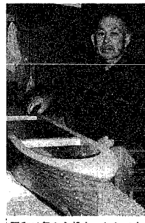
昭和19年から船大工として木造船を造る。昭和52年から果内でただ一人の製作者として模型船を作り続けている