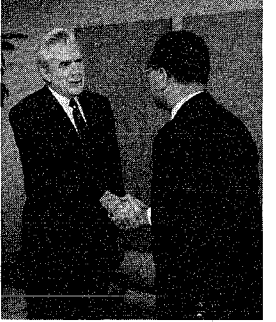
友好を誓い握手するチジョフ大使(左)と長谷川市長

リュドビク・チジョフ駐ロシア連邦大使が、五月二十三日、長谷川市長を訪問しました。