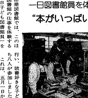
ちよびり緊張どきの子どもたち

沼垂図書館では、このほろほろの仕事を体験する「一日子ども図書館員」を、五月一日から十