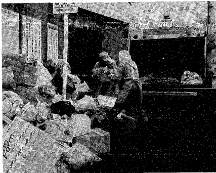
ルールを守ってごみ出しを

四月から、西新潟地区で「びん缶」プラスチックの資源物回収を加えた六分別収集がスタートして一カ月余りがたちました。市民の皆さんの協力により、四月の一カ月間で回収された資源物は約六百、内訳は「びん缶」が約二百八十、プラスチックが約三百三十四に上り、ごみの減量とリサイクルに大きな効果をもたらしています。