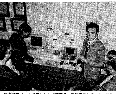
昨年新潟メッセで行われた「新製品・新技術コンクール」から

市では、地域産業の振興と活性化を図るため、中小企業が大学などの研究機関と共同で行う研究開発に対し、その経費の一部を助成する。中小企業共同研究開発支援事業」をスタートします。