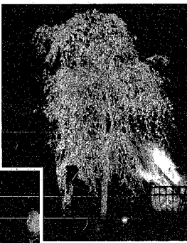
かがり火に幻想的に浮かび上がるさくら(上) 見入る市民(左)

昨年に続き、二年目となったじゅんさい池公園の桜のライトアップ。当初予定した四月十二日から十四日までは、気温が上がらず、つばみ程度のままであったことから、急ぎよ、