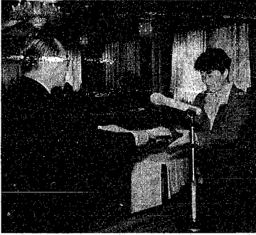
レポーターに委嘱状が渡されました

市では消費生活に関する意見や要望、情報を提供し、市民が安心して生活できるように「くらしのレポーター」の委嘱式をこのほど行いました。