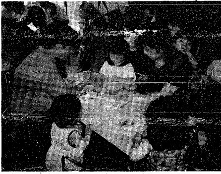
親子で遊びながら仲間づくり～東中野山保育園

子どもと一緒に遊びながら、親子で子育ての悩みを話し合ったり、情報交換をしたり、仲間づくりの場を実施しています。