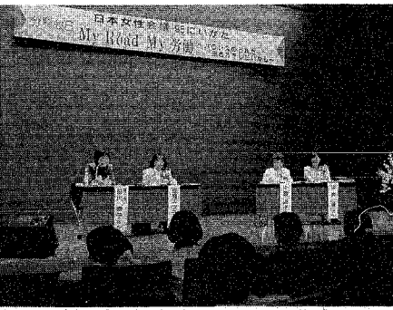
昨年の日本女性会議では女性と労働をテーマに分科会も開かれました

五月三日は憲法記念日。市では私たちの身近な問題をおとて、憲法が暮らしの中でのどのように生かされている、どのような役割を果しているのか考えるきっかけとして、「憲法記念市民のつどい」を開催します。