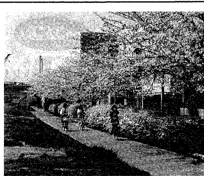
桜で彩られるやすらぎ堤

問い合わせ ①-④ 商工振興課 (☎内線2522番)へ ⑤ 環境対策課 (☎内線2723番)へ *信保付とは信用保証協会の保証付きの略