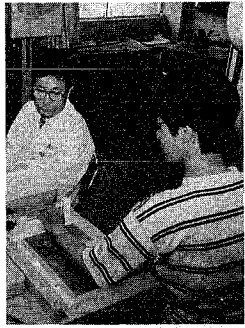
骨密度検査の様子

女性に多くみられる骨粗しょう症。これは、骨の組織が粗くなりスカスカになつてしまい、ちょっとしたはずみで骨折したり、腰が曲がったり、背が丸くならたりする症状が出るものです。 六十歳代の女性で四八%がかつているといわれる「骨粗しょう症」。主な理由としては①男性に比べてもともと骨が細い②女性ホルモンの更年期以降に急に減少する③妊娠・出産でカルシウムを使う④の三つがあげられます。