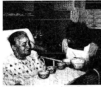
福祉公社まごころヘルプの活動の様子

社会福祉の関係では、高（仮称）の事業が本格的に始動する。ボランティアやボランティアの皆さんが活動の拠点となる総合福祉会館などを用意する。本年度は、本年度に実施設計と用地取得を行い、十年度の完成を目指す。障害者や高齢者にやさしいまちづくり推進事業では、「まちづくり総合計画」の策定に引き続き取り組み、新たに本年度から二カ年で市庁舎や地区事務所など市の施設二十六カ所へ入り口の改善や障害者用トイレの設置を行う。