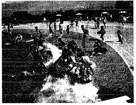
本格オープンする山の下山浜公園の造波プール

集団資源回収を継続するとともに、家庭の生ごみ処理は、従来のコンポストに加えEMボカンについても減額販売します。佐潟の自然環境を整備。佐潟のラムサール条約の