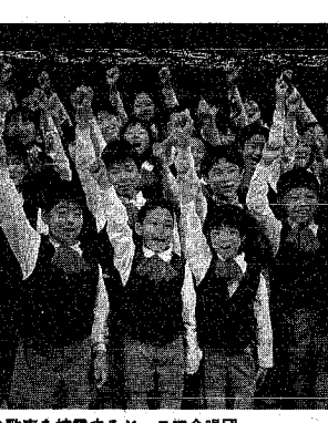
元氣な歌声を披露するジュニア合唱団

音楽文化会館では、ジュニアオーケストラ教室、ジュニア合唱団、ジュニア邦楽教室の受講生を募集しています。音楽を通して仲間づくりに、より高いレベルの音楽活動に、どうぞ参加ください。 申し込み 同館で開催される、各教室の説明会に出席ください。(小学生は保護者同伴)