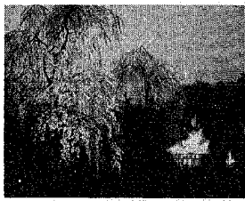
幻想的に浮かび上がるしたれ桜

じゅんさい池公園（松園）のしだれ桜を、昨年に続き、かがり火をたく中でライトアップするの、ライトアップするのは、東池近くの三本のしだれ桜。京都山公園のしだれ桜から分けられた銘木で「祇園」呼ばれるもの。平成元年に「桜6」