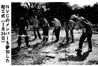
ベトナムに小学校を贈る 緊急支援を進めている新潟 国際ボランティアセンター

NVCのメンバーも参加した 起式(2月24日) ベトナムに小学校を贈る緊急支援を進めている新潟国際ボランティアセンター(NVC)は、市内のボランティア団体などから募ったベトナムに小学校を贈る起式(2月24日)に参加した。NVCは、ラオスの子ども