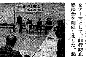
万引き防止について話し合われた非行防止懇談会

四月一日から老人・妊産婦、乳幼児、重度心身障害者、ひとり親家庭医療受給者が医療を受ける際に、医療機関の窓口で支払う外来時の一部負担金が一月千二百円に改定されます。 平成八年度の医療機関の窓口で支払う一部負担金は次のとおりです。 外来 一月千二百円 入院 一日七百円 妊産婦、乳幼児医療：保健衛生課(内線2707番)重 度心身障害者医療：障害福祉課(内線2623番)福 ひとりで親家庭医療：児童福祉課(内線2617番)