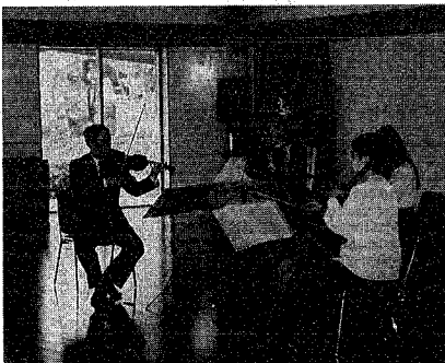
天寿園のホールで行われたクラシック演奏(同園のオープニングセレモニーから)

勸市都市緑化推進協会は、市民の多くを占める皆さんの所有地を緑化するごとき、まちの緑を増やそうと設立された財団です。同じく、市民の協力を得ようとして賛助会員を募集しています。