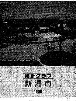
表紙の写真は市庭球場「テニスガーデンにいがた」

水道管は気温がマイナス三度以下になると凍結・破裂が増えます。凍結したら蛇口を開閉してタオルで覆い、上からお湯をかけて