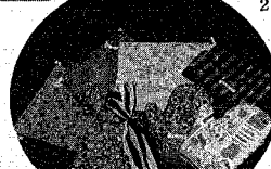
福祉の店(販売)している 手づくりの便利袋や腕カバーなど

市内には、知的障害や身体障害を持つ人が社会参加を願いながら、仕事の場や体力づくりのために、洗濯バサミ組み立てなどの作業に取り組み立っています。ここでは、各施設が手掛けている下請け作業や自主製作の製品などを紹介します。●表1。 福祉の店・パレット(青山) 二、ジャスコ新潟店内②