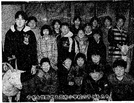
中々を世話する笠木小学校の子どもたち