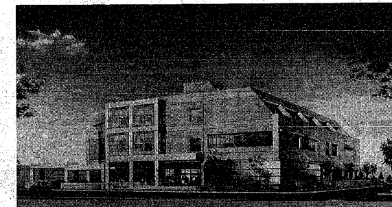
西新潟地区の生涯学習の拠点に(完成予想図)

20日から2月臨時市議会 補正予算など9議案を提案 二月臨時市議会が、今月二十日から二十三日、開開議され、一般会計補正予算など九議案が提案される。除雪対策費に三億円など 市社会福祉協議会では、市民の協力で除雪をすすめる「いのりひとかき運動」を今冬から始めました。この運動は、バスや信号の待ち時間を利用して歩道の除雪をお願いするもの。 雪が歩にくく、また滑りやすい歩道を、普連の雪かきによって歩行者の安全を守り、そこから助け合いと思いやりの心を育てようという目的を掲げられています。