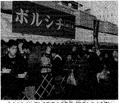
多くの人でにぎわう昨年の当日座 (万代シテイ会場)

新潟の味覚を熱く盛り上げる冬の風物詩「にいがた冬の食の陣」の当日座と週間座がいよいよスタートします。