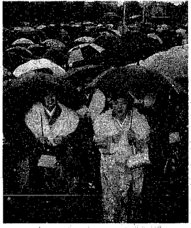
雨天の中、会場へ向う新成人