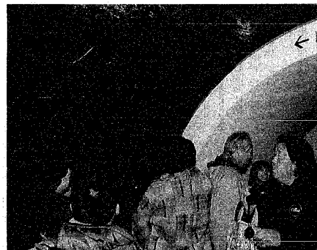
海底散歩の雰囲気味わうことができるマリニピア

市民が気軽に楽しめる施設として親しまれている水族館「マリニピア日本海」では、一月二日から利用できる無料招待券の効果もあって、例年を上回る入出でにぎわっています。 冬休み期間中の二日から七日までは、二万二千九百人の入場者数で、前年の九千九百九十九人の約二・四倍。このうち無料招待券を