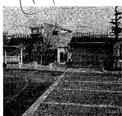
高速バス利用者のために整備した両川駐車場

駐輪場があります。地域の憩いの場として美観や公園的要素にも配慮し、駐車スペースには芝生付きのブロックを使用し、駐車場の周囲にはケヤキをはじめ、タブノキ、ハナミズキなどの植樹を行いました。また、円形の木製ベンチなども設置しました。