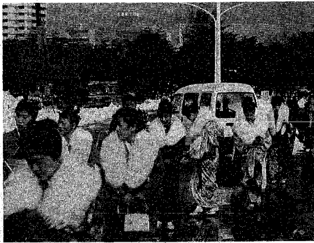
新たな旅立ちに多くの新成人が参加～昨年の成人式から

あす十五日は成人の日。成人式を迎えるに当たって知っておかなければならないことも多いはず。そのうち大切な制度と心掛けを紹介しします。