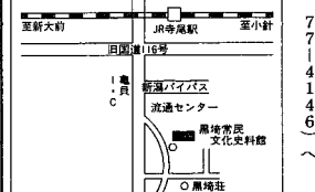
黒埼町民文化史料館

黒埼町にある「黒埼町民文化史料館」は浦原地方の農村の暮らしが伝わってくる郷土資料館です。ここでは、移築復元された