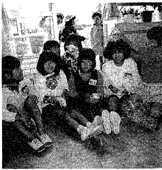
モルちゃんを世話している1年3組の皆さん