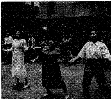
大会に向け練習をする創作劇の出演者

約二百人の実行委員の手で、着々と準備が進められている「日本女性会議'95にいがた」が、いよいよ十月十二日、十三日に県民会館をメイン会場に開催されます。大会には、予選を大躍進に上回る二千三百人が参加します。プログラムの第一は、世界女性会議NGOフォーラムに派遣した市民の報告など、話題が豊富。大会に先立ち、十月六日から、にいがたウィークも始まり、十月七日からは、本大会は今まで本間としての創作劇や七つの分科開催してきた「にいがた女性大会」の実績を生かし、性問題の初めは女性と運営を行っている点など、世界女性会議NGOフォーラムに派遣した女性市民の