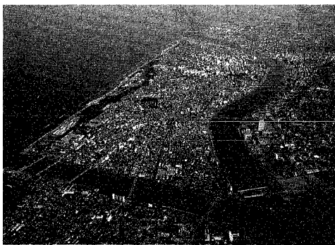
中核市の指定で個性豊かなまちづくりを

先月二十九日、本市は全国十二都市とともに、自治省から中核市指定の内諾を受けました。中核市指定は、一定規模を持つ比較的大きな都市に、法令を受けて市では、市議会の議決を得た後、県の同意を得て、自治省へ正式に申し出を行う予定です。